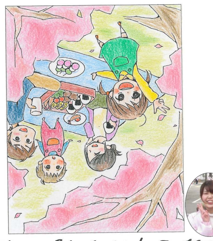
答えは次号!お季しみに! 图田有积乃 何つくしま第十刊へ答えA, F, K, L, N